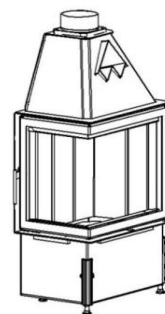
CHOPOK R90-S/450 L